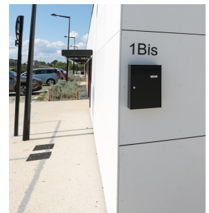
Consultations paramédicales et autres