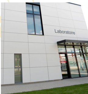
Laboratoire de Biologie