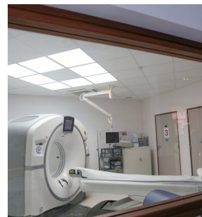
Centre de Radiologie Scanner