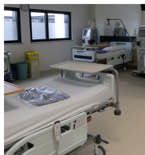
Centre de Dialyse Médicalisé